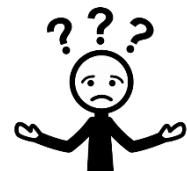
No lo sé