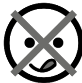
No me gusta