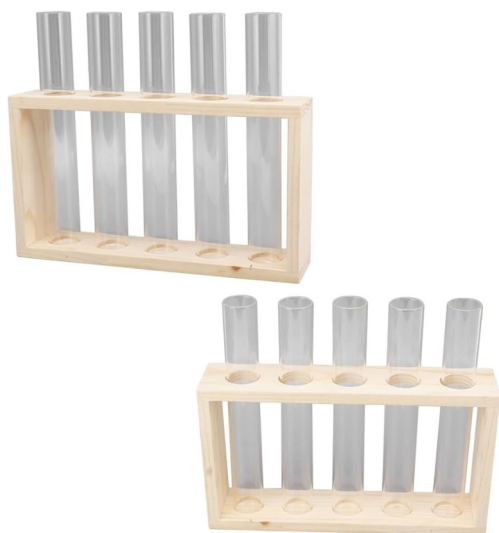
TUBOS DE ENSAYO