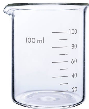
VASO DE PRECIPITADO