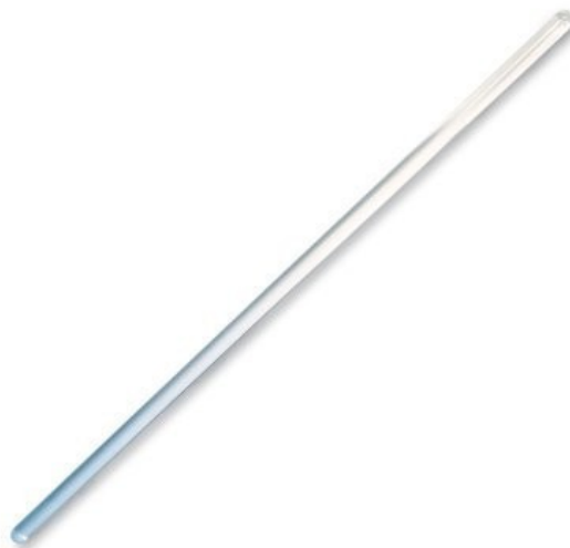
VARILLA DE AGITACIÓN